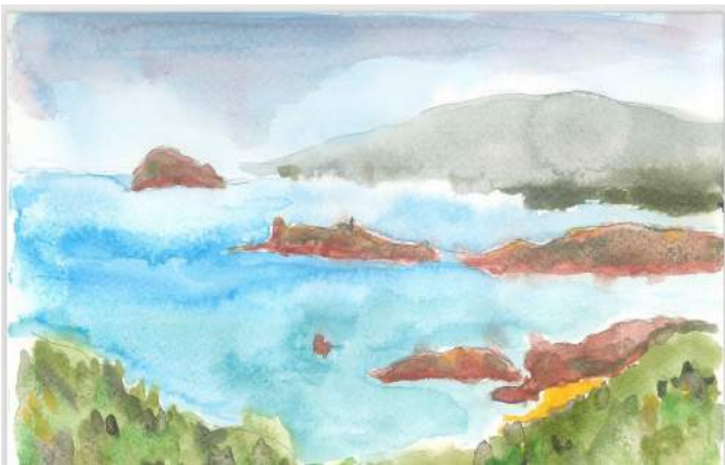
圖 畫於文理學院圓通海印的海天一色