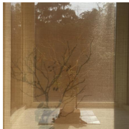
( 僧伽大學教務處花影 )